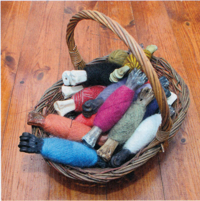
Práðarleggir með jurttalituðu bandi.